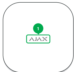
1 - Логотип зі світловим індикатором